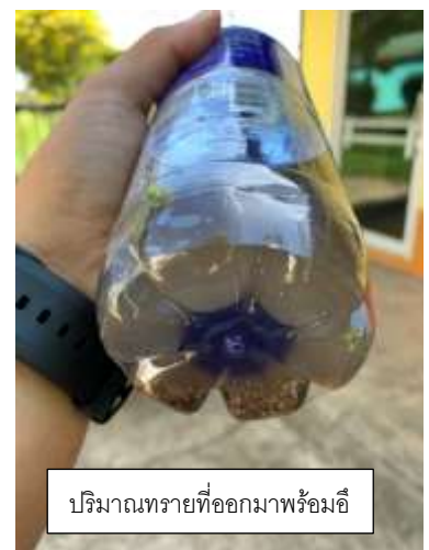
ปริมาณทรายที่ออกมาพร้อมอึ